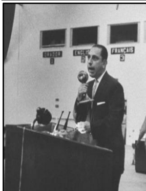
Nació en Caracas el 12/03/1917 Murió en Caracas el 12/09/1987